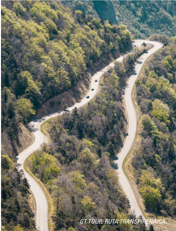
GT TOUR: RUTA TRANSPIRENAICA