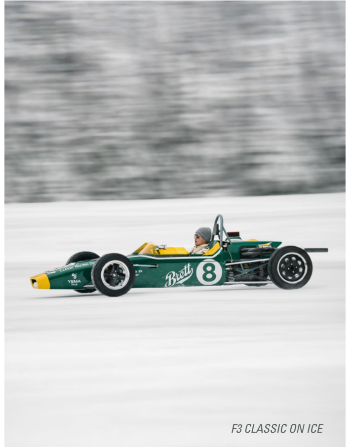
F3 CLASSIC ON ICE